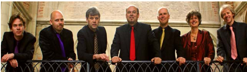
enkele leden van Accademia Amsterdam