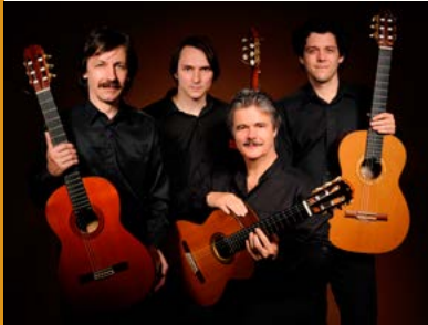
Praags Gitaar Kwartet

Muziek uit de 17 e tot 19 e eeuw voor VIER gitaren